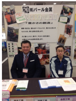
〈2017 合同企業説明会にて〉

リーマンショック以降、下降傾向にあった大卒の内定率は、大手企業の業績・景気の回復とともに、ここ数年は上昇傾向です。企業間での学生の争奪戦は、さらに熾烈化しています。そんな中、弊社をエントリーしていただく為には、将来の「あるべき姿」を明確にお伝えしなければなりません。自社の将来のビジョンと、学生の「将来の姿」がマッチングすることが大切だと考えます。学生に選んでいただける「経営ビジョン」を描き、そのビジョン実現の為に、学生の「将来の姿」とマッチングした出会いが出来るよう、取り組んでいきます！