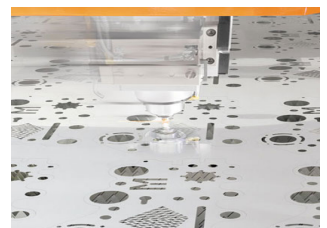
〈レーザーカット加工〉