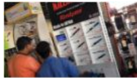
〈工具販売店舗にて〉

2017年7月1日 UAE のドバイ支局を開設いたしました。弊社としては初となる、本格的な海外事業展開です。ドバイを中心とした UAE (アラブ首長国連邦) での営業が展開できるよう、ジャパントレードセンターを拠点として、活動していきます。UAE では、部品加工などの製造業があまり無い代わりに、自動車整備工場、建築業、プラント設備などの業種が数多く軒を連ねます。その企業に機械工具を卸している問屋が、最初のターゲットです。しかし競合となる国も、沢山あります。UAE の周囲はほぼ陸で繋がっています。そのためヨーロッパから高精度な製品と、東南アジアから安価な製品が数多く輸入されています。その中で日本の製品は、まだまだ使用されてなく、最後のフロンティアとも言われています。メイドインジャパンの高品質な製品を、いかに東南アジアの価格に近づけて販売できるかが、市場開拓のカギとなるかもしれません。