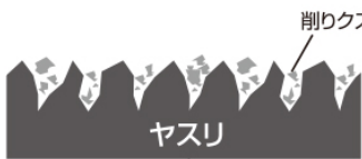
ジェットブラックヤスリセット