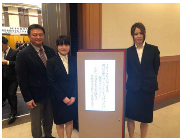
〈2018年合同入社式にて〉

会社に戻ってからの4月5日・6日・9日三日間は、弊社「新入社員研修」を行いました。毎年、私どもの「新入社員研修」に合わせて、お客様の新入社員をお預かりして、一緒に研修いたします。今年は弊社2名に、3社の新入社員を受け入れて、開催しました。皆様の今後の活躍に期待です。また年度初めのお忙しい中、ご参加いただいた企業の皆様、誠にありがとうございました。