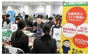
〈2018 合同企業説明会にて〉

今年は3月23日・4月17日・18日・6月20日の四日間愛知中小企業家同友会が主催する、2019年新卒採用の合同企業説明会に出展いたしました。弊社の新卒採用も今年で7年目となります。ここ数年は売手市場で、学生に有利な状況が続いています。今年の動向は、早く囲い込みたい企業と、早く内定を決めたい学生の短期決戦です。そのため学生は興味のない業種・企業の説明会には参加しない傾向です。売手市場により学生は会社を選べますが、企業にとって人材獲得が難しい状況です。そんな中、弊社にエントリーしていただく為には、学生の視点「何のために御社に入るのですか？」という目的を明確にしなければなりません。自社の「将来のビジョン」と、学生の「将来の姿」がマッチングして、学生に選ばれる会社を目指します。学生に「あなたと会えてハッピー」と言える、弊社と学生の将来を決めるマッチングが出来るよう取り組んでいきます！