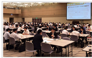
＜愛銀ビジネス商談会＞

10月24日（水）名古屋国際会議場[1号館1階イベントホール]にて愛知銀行様が主催する「第19回愛銀ビジネス商談会」が行われました。昨年の実績は参加企業数539社、商談件数は1,042件のも及びます。今年の参加企業数は859件で、弊社も6件の商談機会をいただきました。今回、色々な商材をご紹介する中で、パートナー企業の(株)エネリンク様にもお力添えをいただき、新電力のご提案もさせていただきました。今後、各企業様にあった商材をより深くご提案させていただきたいと思っております。こちらの商談会では様々なビジネスサポートも行われています。各企業の技術相談、共同研究、知的財産活用等の技術開発ニーズを大学や外部機関へつなぎ、実用化へ向けた支援をしていただけます。また提携コンサルティング会社等による各種経営相談、海外進出の相談等も受けられます。弊社も産学官、外部機関のサポートが受けられる企業を目指します！