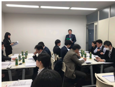
〈弊社45期経営指針発表会〉

2019年さらなる飛躍を遂げるため、平成31年1月19日(土)第46期経営指針発表会を開催させていただきました。4月からの新入社員2名も参加し、金融機関様やお取引様など多数お越しいただき、24名での開催となりました。今回の発表会は、弊社2階に新設したセミナールームのお披露目も兼ねて行いました。このセミナールームの活用も含めて、長期ビジョンを基に、5ヵ年ロードマップの見直しから単年度方針・単年度計画を、各担当者が発表させていただきました。その後はグループ討論で、ご来賓の方々から様々な意見を賜り、より良い指針書に改定することが出来ました。