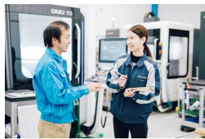
<お客様との打ち合せ>

今年1月にコーポレートサイトとは別に、ソリューションサイトを立ち上げました。( https://www.n-koji.com/ ) その名は「名古屋工場生産技術・保全代行.COM」です。 弊社は「生産現場の困った」を解決する、総合商社です。 お客様ではやりきれない部品加工のお手伝いや、設備や機械・機器の保全、工場の工事やリフォーム等、多岐にわたってお手伝いをさせていただいています。その為「生産財」の販売だけをする商社ではなく、地域密着で、試作部品、治工具・部品加工、工場工事・リフォーム、設備・機器の保全業務などのサービスを代行する、生産技術総合・代行商社です。プロフェッショナルであるお客様の「生産現場の困った」を解決するため、私たちがプロフェッショナルにならなければなりません。全員で学び合い、育ち合ってお客様を支える「プロフェッショナル」になるために、日々皆で精進してまいります。