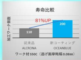
長寿命を実現(当社比)