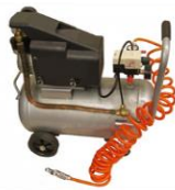
＜コンプレッサの基礎＞

12月9日(水)に、第10回オンラインセミナー 【特定化学物質障害予防規則の改定、工場清掃について】 と12月16日(水)に、第11回オンラインセミナー 【測定工具・ゲージの基礎その2】 を開催しました。両日のオンラインセミナーにご参加いただきました皆様、誠にありがとうございました。来年の無料セミナーは、現時点では右コラムにある、3月までに月1~2回程の開催予定です。日頃の活動の中、お世話になっている、ものづくりの製造業の皆様、地域貢献事業として「名古屋生産技術セミナー」をオンラインで企画しています。本来ならば、リアルでの開催で、皆様のご意見を直接賜りたいと思っておりますが、コロナ禍の難しい環境です。どんな形でも、やり続けられるよう日々、精進してまいりますので、今後も沢山のご参加をお待ちしています。 よくお願いいたします。